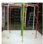
コンクリ土間 打設後