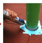
柱穴部 コーキング打